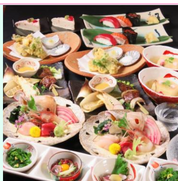
飲放付 8000 円