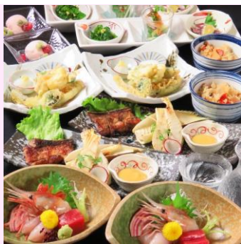
飲放付 6000 円